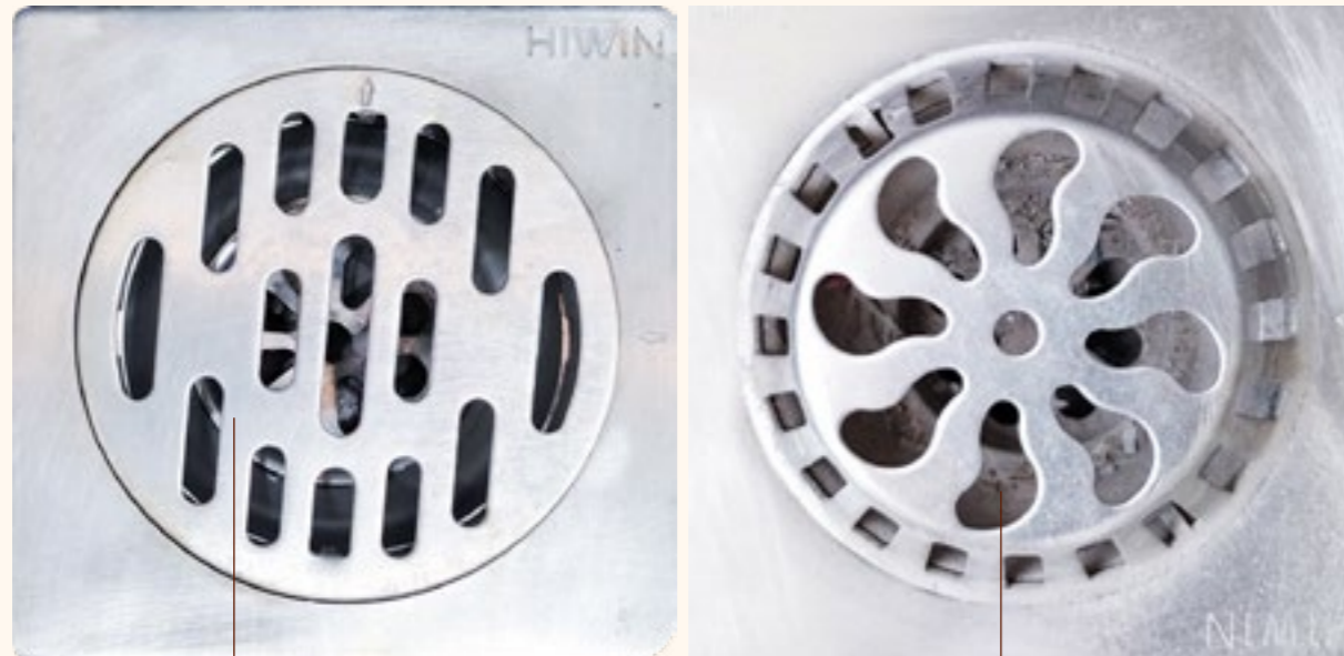
Thoát sàn phòng tắm