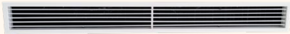
Âm trần nối ống cửa gió ngoài

Điều hòa căn hộ là loại LG multi, mặt lạnh điều hòa trong căn hộ có 02 loại: