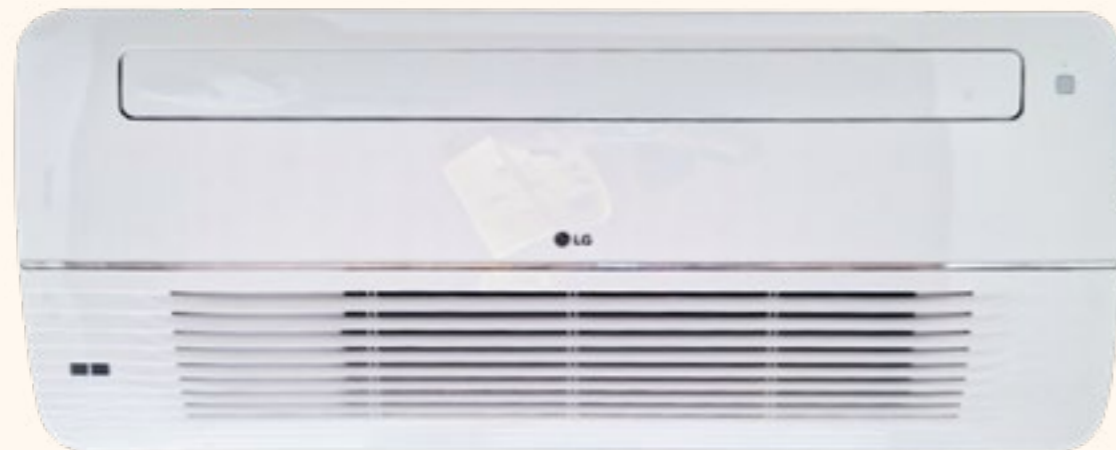
Hãng sản xuất: LG - Multi, cassette hướng thổi

Phòng ngủ Master : TC 3.5kW - Phòng khách : TC 7.1 kW - Phòng ngủ : TC 2.6 kW